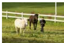
Un éleveur qui a des juments