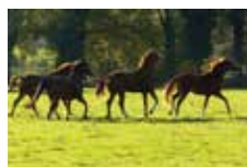
Un agriculteur prenant des chevaux en pension