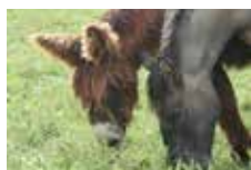
Un particulier ayant un équidé chez lui pour le loisir