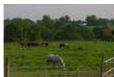
Un gérant d'un gîte d'étape équestre

Les organisateurs de foire et de concours sont également tenus de déclarer les lieux de détention si ceux-ci ne sont pas déjà déclarés, c'est à l'organisateur principal sur le lieu de réaliser la déclaration.